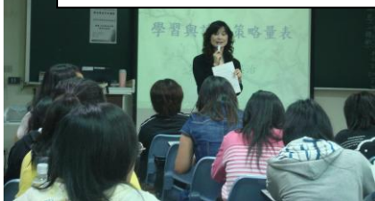
圖 15. 策略講座上課情形

的呈現，了解自己的學習態度、學習動機及時間管理等方面，並且找出適當的辦法，幫助自己學習；此外也協助同學減輕學習及課業上的壓力，給兩勢當的讀書方法，以及幫助學生了解自己的興趣與未來發展。而「研究計畫撰寫工作坊」則是讓學生了解，自己所寫的研究計畫對於所屬領域的貢獻度為何？研究結果如何應用於實務之中？藉由三場講座，讓參與的學生更加肯定自己所選擇的科系，並且發現學習樂趣，更有動力繼續努力。