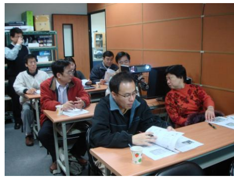
圖 13. 資工系教師參與研習活動

還有瑞晶資訊股份有限公司協理陳志成演講 2.45G 的主動式 FRID API 程式設計與使用及 FRID PDA 程式設計與開發。兩天的活動，不僅強化了教師的實務能力，也讓產學兩邊有了新的合作。