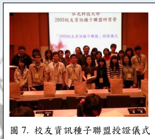
圖 7. 校友資訊種子聯盟授證儀式

本校研究發展處，致力於畢業校友聯繫追蹤、應屆畢業生未來發展等相關事務，幾年下來，成效日漸彰顯。為了讓承辦的事務更扎實，辦理的活動能給予更多啟發，3月20日與21日，特舉辦了「2009校友資訊種子聯盟」與「社會新鮮人」兩場研習營。「校友資訊種子聯盟」，期待聯盟代表在服務、領導、溝通等方面都擁有相當的能力，因此邀請了劍湖山世界休閒