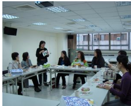
圖 3. 幼保系與業者進行交流

為發展優質學習情境，提昇教師實務能力，本校幼兒保育系於 98 年 03 月 09 日至 04 月 11 日舉辦「教師至業界典範研修計畫」，讓十四位教師至幼保相關職場進行實務經驗交流，期盼藉由單位業者的分享，能讓教師吸收更多新穎的觀念與實務經驗，以利往後在教學上能夠將理論與實務結合，傳達更多新資訊於學生。在參訪的單位及內容上，包括了世平興業附設員工子女托