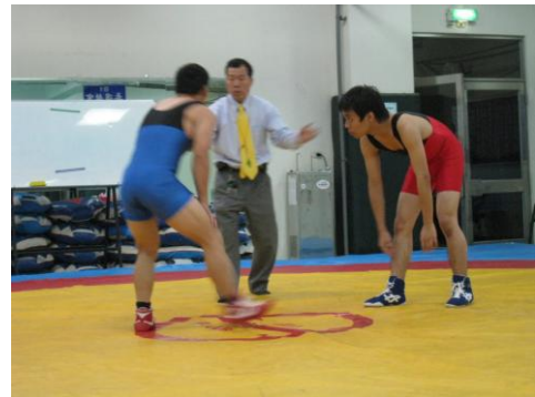
圖 22. 角力研習活動

本校體育教學研究中心，自去年起舉辦國武術運動教練裁判研習，讓許多參與的學員更加熱衷武術，對武術相關技巧與規則更加了解，並且預定於本學期陸續參加校外比賽。有鑑於此研習的成功，體育中心在三月份又舉辦了排球與角力的裁判研習營。排球方面，目的在於培養大專院校排球裁判，增