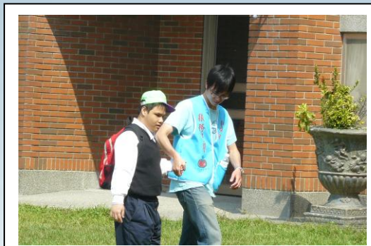
圖 12. 本校學生服務惠明學生