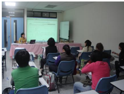
圖 14. 策略講座上課情形

本校教學資源中心，為了提昇學生學習效果、強化學習態度，一連舉辦了三場「學習方法系列講座」，循序漸進帶領學生了解「學習」，從中發現興趣，並且用示當的方法，讓自己成為學習達人。在兩場的「學生學習與讀書策略講座」中，幫助學生用「大學生學習與讀書策略量表」了解自己學習的十個面相，藉由量表的呈現，了解自己的學習態度、學習動機及時間管理等方面，並且找出適當的辦法，幫助自己學習；此外也協助同學減輕學習及課業上的壓力，給兩勢當的讀書方法，以及幫助學生了解自己的興趣與未來發展。而「研究計畫撰寫工作坊」則是讓學生了解，自己所寫的研究計畫對於所屬領域的貢獻度為何？研究結果如何應用於實務之中？藉由三場講座，讓參與的學生更加肯定自己所選擇的科系，並且發現學習樂趣，更有動力繼續努力。