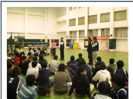
圖 23. 排球研習活動

體育總會認定合格者，予以核發排球 C 級裁判證；角力則是讓參與者，更加熟悉國際角力新規則及裁判法，以提升本縣裁判素質及技術水準。同樣，在研習結束後，經中華民國角力協會認定合格者，予以核發角力 C 級裁判證。