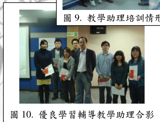
圖 10. 優良學習輔導教學助理合影

經 98 年 2 月 17 日，弘光科技大學 97 學年第一學期優良教學助理遴選會議決議，遴選出 20 位教學助理接受表揚。此次將教學助理培訓與表揚大會一起舉辦，目的藉由優良教學助理的擔任經驗及成果分享，能讓在場所有