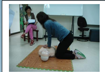
圖 6. 心肺復甦術上課過程

2.舉辦本位課程發展研討會。為了讓課程更符合社會脈動，檢視課程架構及發展，物治系於03月19日舉辦本位課程發展研討會，討論學生第