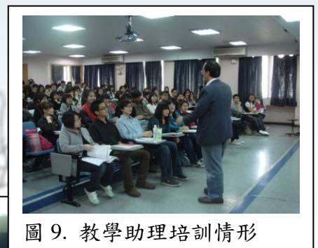
圖 9. 教學助理培訓情形

本校致力發展優質學習情境，期待教師能有更充足時間準備教學內容、輔導與關懷學生，因此本校各科系教師皆有學生擔任教學助理，協助各項事宜。為了提昇教學助理品質，讓其更了解工作重要性，教學資源中心於 98 年 03 月 12 日，舉辦了「97 學期教學助理培訓暨 97 學期優良教學助理表揚大會」。